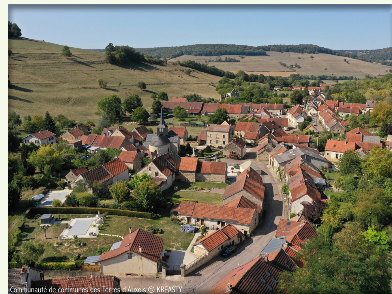
1 Vue aérienne sur Saffres